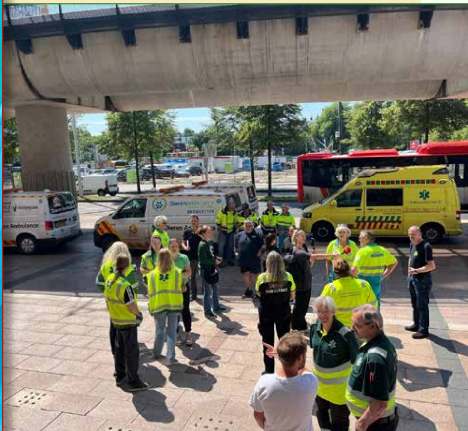
Bij het RVO in Den Haag