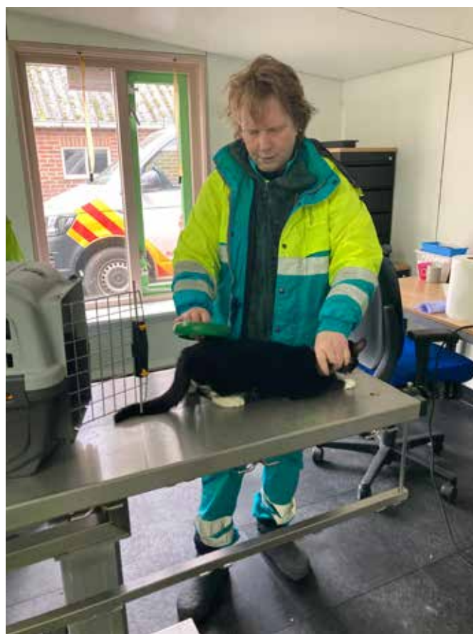
rechts: chip uitlezen