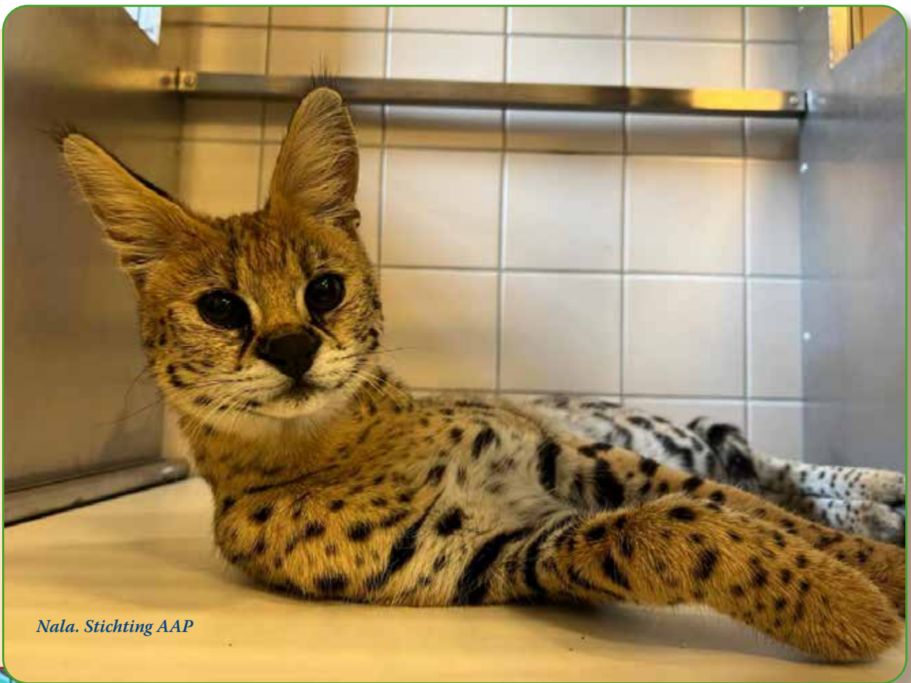
Nala. Stichting AAP