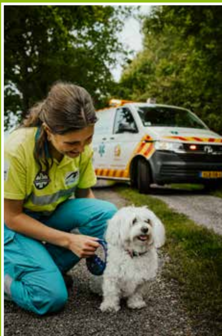
Voorplaat: fotografie Studio Maltipo

Namens het bestuur wil ik eenieder bedanken voor de steun en inzet die wij ontzettend hard nodig hebben om de DAV draaiende te houden.