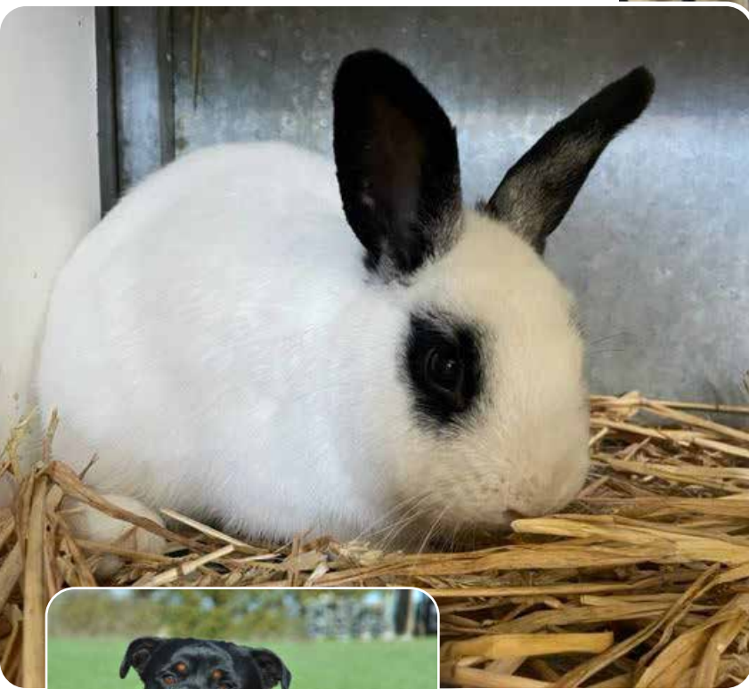
Konijn Rammetje, een agarpornis, een Rottweiler en kittens in Dierenasiel Gorinchem