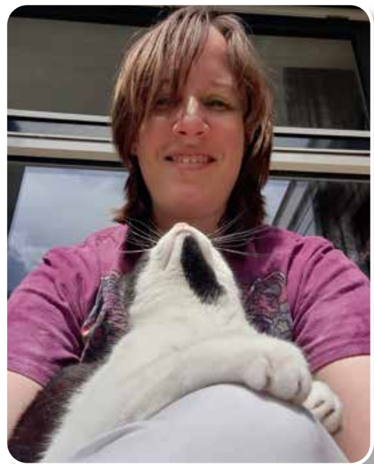
Thuis met mijn eigen kat.

Iedere vrijwilliger heeft zijn of haar portie aan zielige dierenverhalen. Persoonlijk kan ik daar redelijk goed mee omgaan omdat ik weet dat wij het dier helpen, ook al kan je ze niet altijd