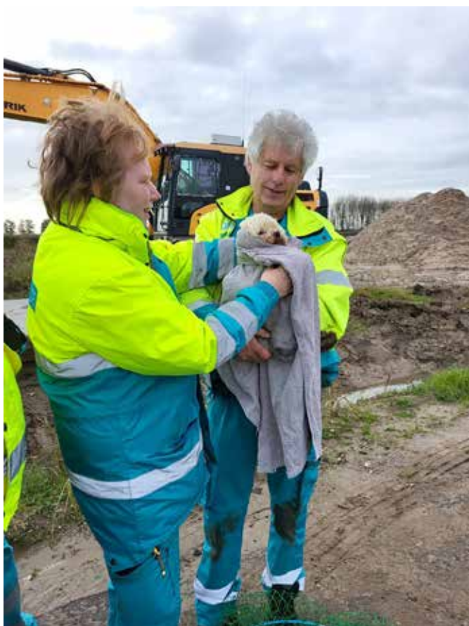
Links: Daisy vermist

Het komt ook voor dat de eigenaar afstand wil doen van zijn of haar hond, kat, knaagdier of huisvogel. Gedurende hun verblijf krijgen deze huisdieren alle verzorging die ze nodig hebben. Wanneer er sprake is van een gedragsprobleem kan ook contact opgenomen worden met het Dierenasiel.